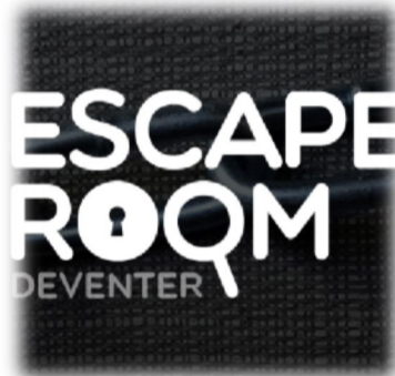
Geslaagde RCEC Alumni en Aio bijeenkomst